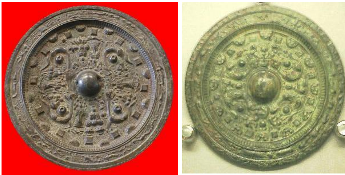
فرتور 2 نمونه های آئینه "کاگامی"

در زندگانی البته بعید نیست که این آئینه ها فارغ از معنای باطنی آن از کاربرد واقعی روزمره مردم برخوردار بوده باشد 5 .