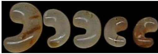
فرتور 3 مهره "ماگاتاما" بشکل هلال ماه و گردنبندی که از مهره ها آراسته شده است.