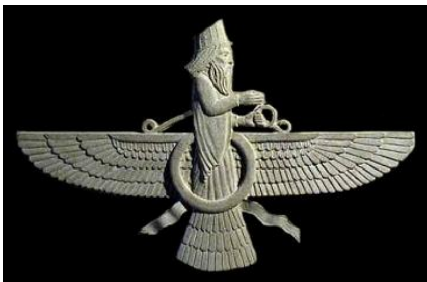
فرتور 6 آرم شهریار شایسته