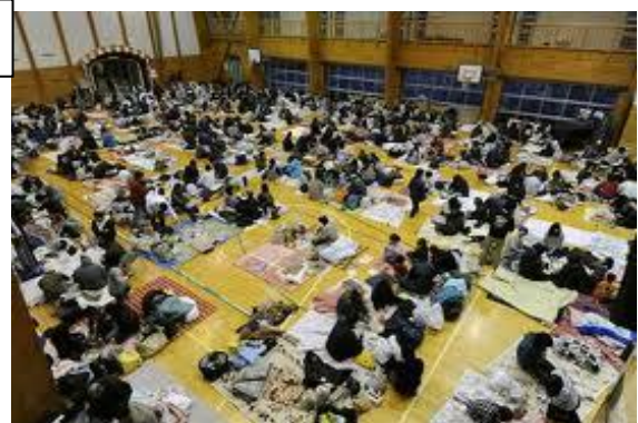
ساکنان همجوار نیروگاه ها

ژاپن ۵۴ پایگاه نیروگاه اتمی برای تولید برق در سراسر ژاپن دارد که حدود ۲۴ تا ۲۶ درصد تولید انرژی برق را برعهده دارند. اولین راکتور اتمی در ژاپن در سال ۱۹۷۰ فعال مولد برق می شود. نیروگاه های اتمی در ژاپن با موافقت و همکاری سه بخش سیاستمدار، سرمایه دار و فن آوران تاسیس می شود. با حادثه اخیر دروغ بزرگ بی خطر، پاک و ارزان بودن تاسیسات اتمی هر چه بیشتر بر مردم آشکار شد.