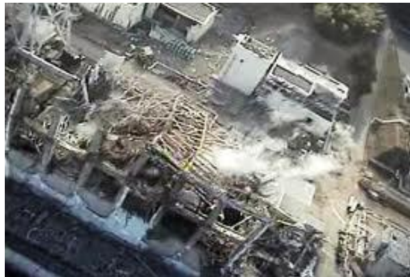
پس از انفجار و تخریب