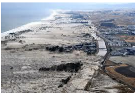
پس از زلزله

وسعت فاجعه را از زبان بی زبان اما گویای تصاویر ببینید.