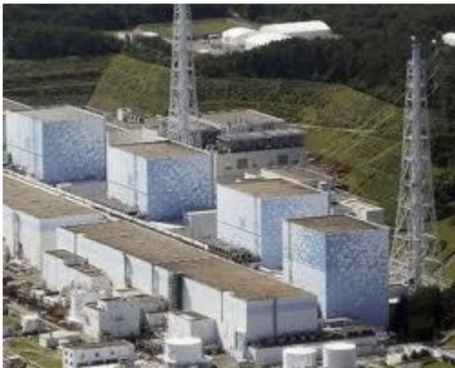
قبل از حادثه

کارشناسان بر این باورند که تاسیسات نیروگاه اتمی فوکوشیما بر اثر زلزله و تسونامی مواجه با تخریب تاسیسات برق رسانی می شود که عمل پمپاژ آب سرد به استخرهای سردکننده راکتورها را مختل کرد. بر اثر افزایش درجه حرارت در نیروگاه ها انفجار صورت می گیرد و از طرف دیگر ذوب لوله های محتوی مواد رادیواکتیو سبب نشت مواد رادیواکتیو مخصوصاً از راکتورهای شماره ۱، ۳، ۴ می شود. اداره امنیت نیروگاه های اتمی و وزارت صنایع ژاپن در تاریخ ۱۲ ماه آوریل شدت حادثه نیروگاه ها را در ردیف حادثه نیروگاه چرنوبیل روسیه در سال ۱۹۸۶ به سطح ۷ (معیاری بین المللی حوادث نیروگاه ها INES) شدت اعلام می کند و در صد تخلیه ساکنان مناطق هم جوار نیروگاه بر می آید. تا تاریخ اول اکتبر صد و ده هزار نفر از مناطق حاشیه نیروگاه تخلیه شده اند.