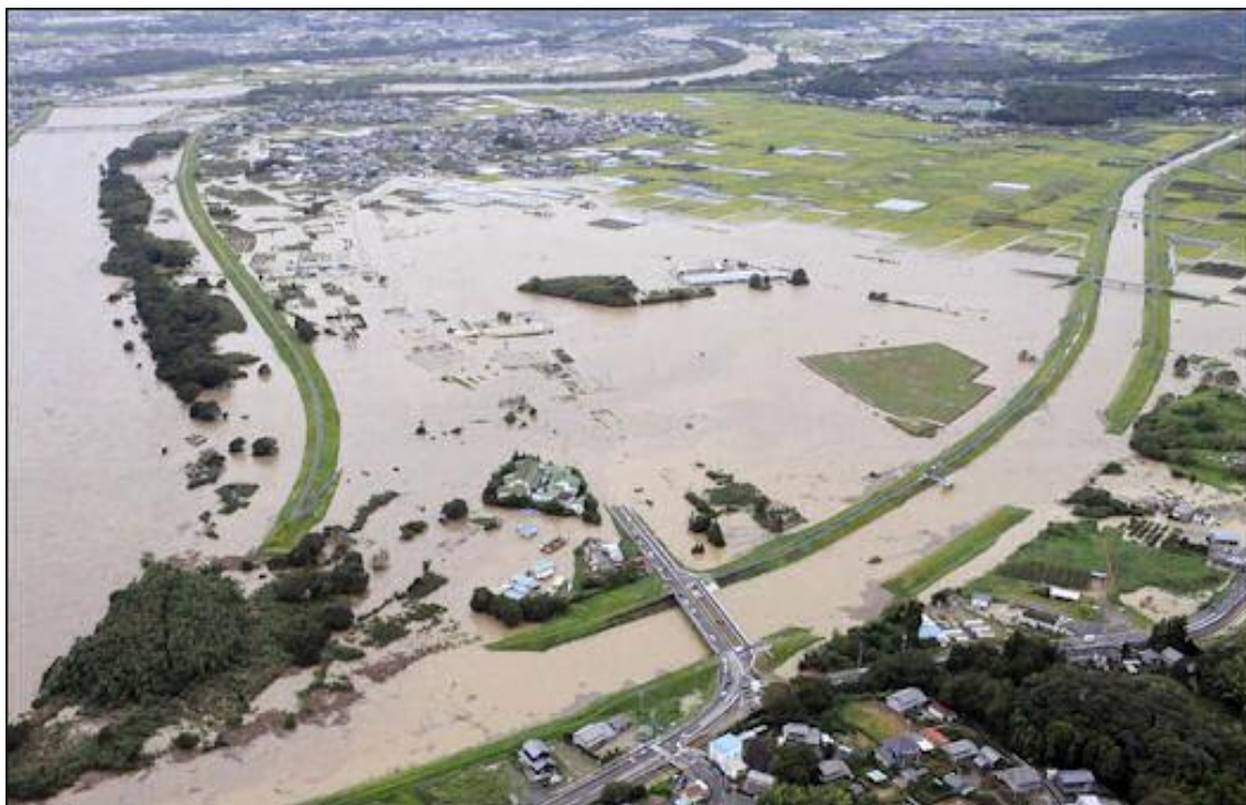
طوفان وسیل در استان کیوتو در تاریخ ۲۱ سپتامبر

۳ سپتامبر طوفان شماره ۱۲ جزیره شیکوکو را هدف قرار داد و طوفان شماره ۱۵ در ۲۱ سپتامبر در استان شیزوواوکا و شهرهای دیگر بوقوع پیوست. تلفات این حوادث طبیعی بالغ بر ۱۱۲ نفر کشته و ناپدیدشده بوده است.