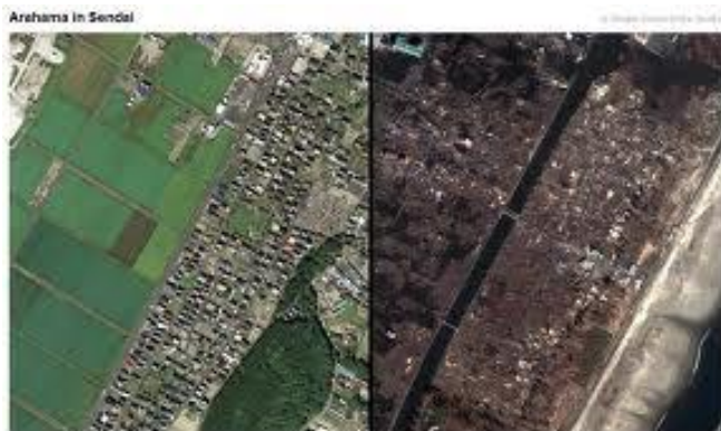
قبل از زلزله