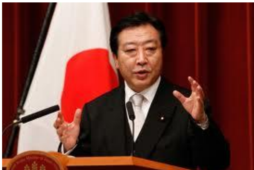
یوشی هیکو نودا (Yoshihiko Noda) نخست وزیر ژاپن- ۵۴ ساله

انتخاب و از ۶۵ درصد حمایت مردم برخوردار شد. اما به جهت ضعف در توجیح ملت به تدریج حمایت مردم از او کاهش یافته است.